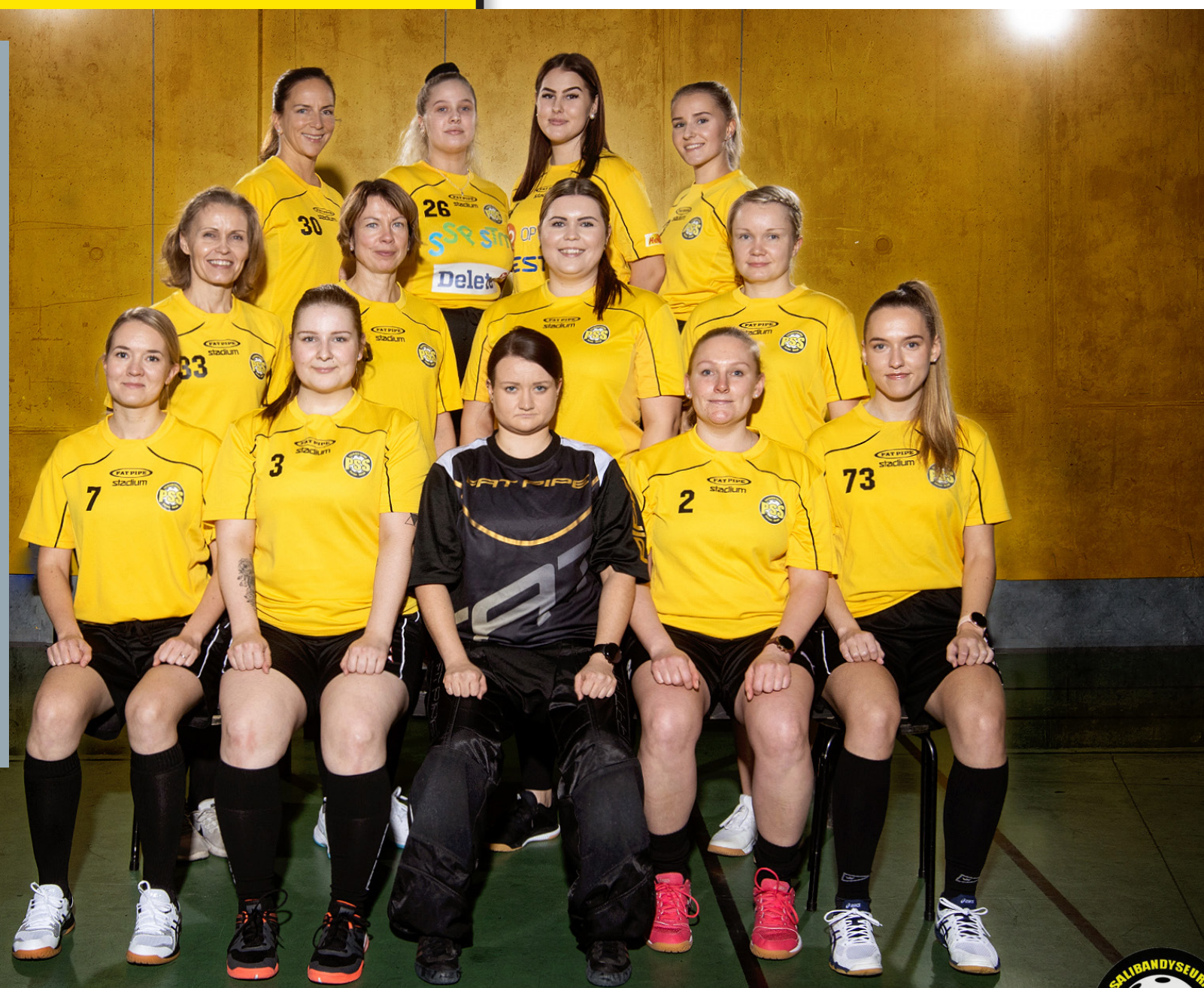
N 3 PORVOON SALIBANDYSEURA 2020 - 2021