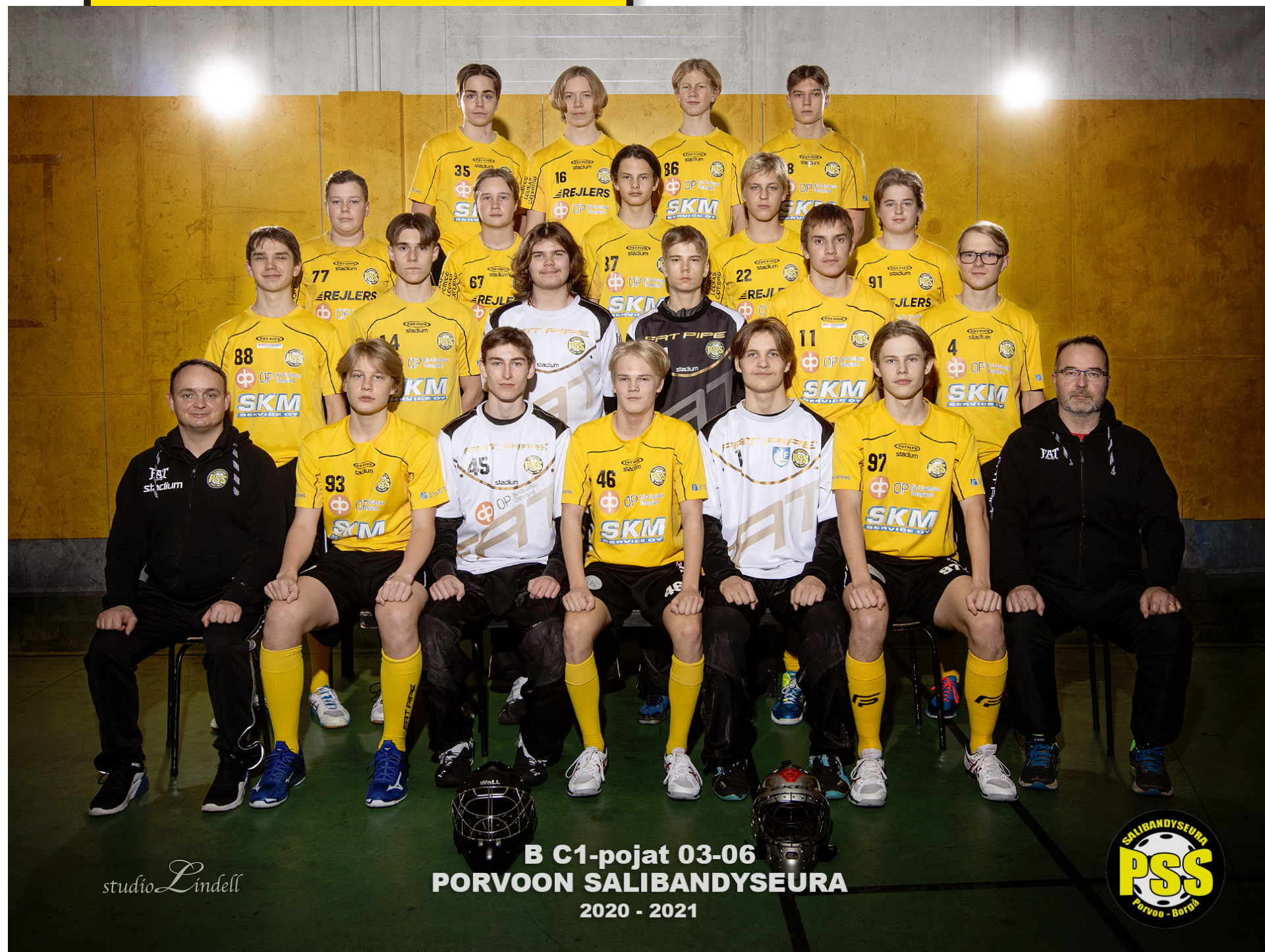
B C1-pojat 03-06 PORVOON SALIBANDYSEURA 2020 - 2021