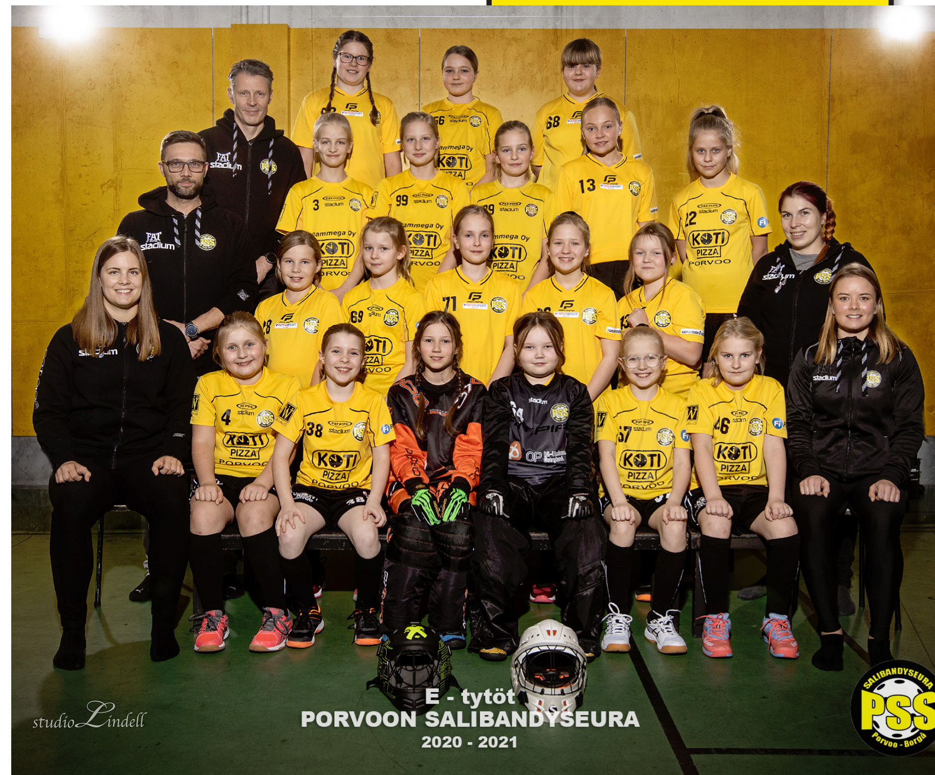
E - tytöt PORVOON SALIBANDYSEURA 2020 - 2021

E-tyttöjen lähtökohdaksi on pelata iloista ja hauskaa salibandyä, viihtyä kavereiden kanssa mukaansa tempaavissa treeneissä liikunnallisissa ominaisuuksissa monipuolisesti kehittämällä ja vahvistamalla, sekä