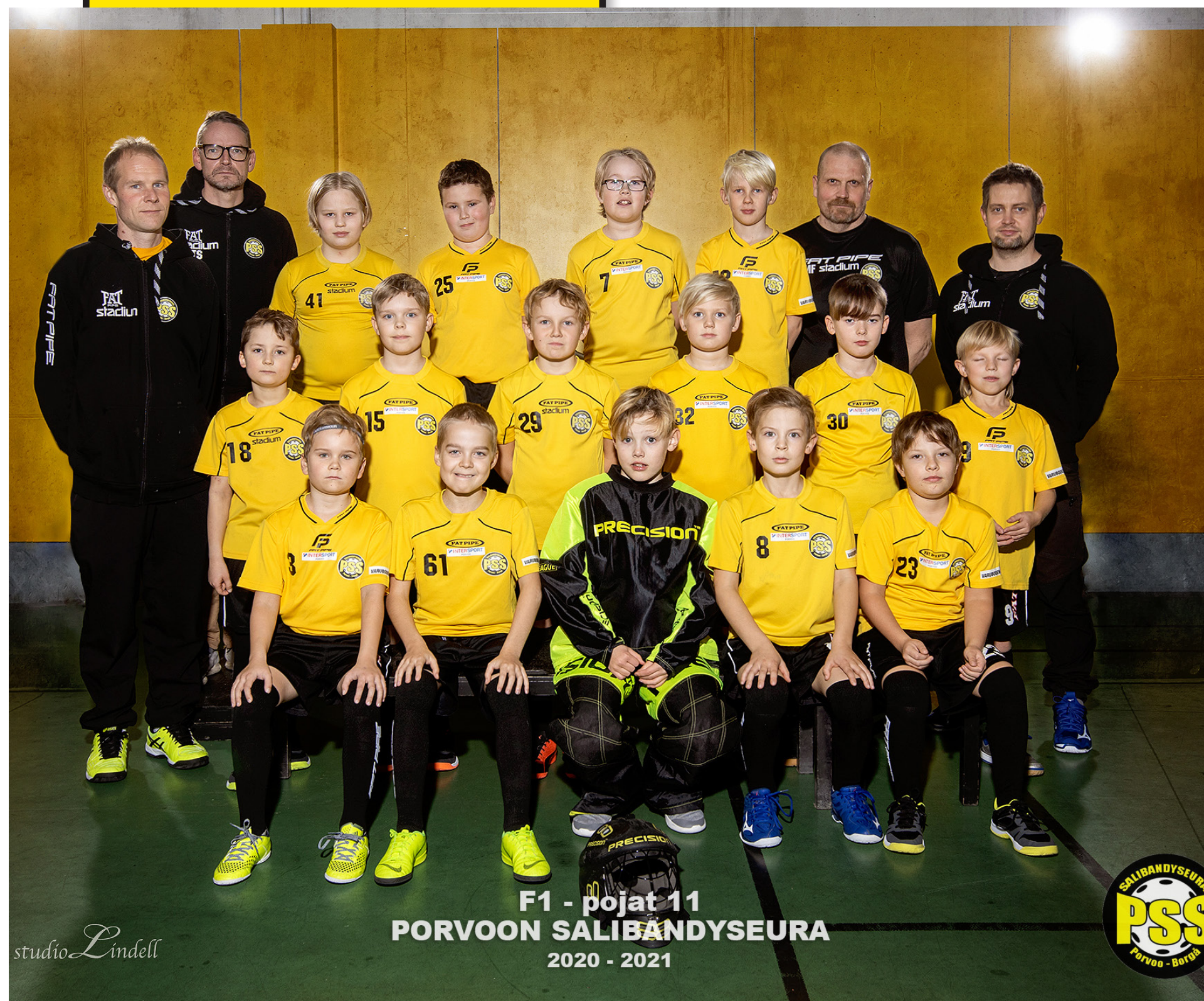
F1 - pojat 11 PORVOON SALIBANDYSEURA 2020 - 2021