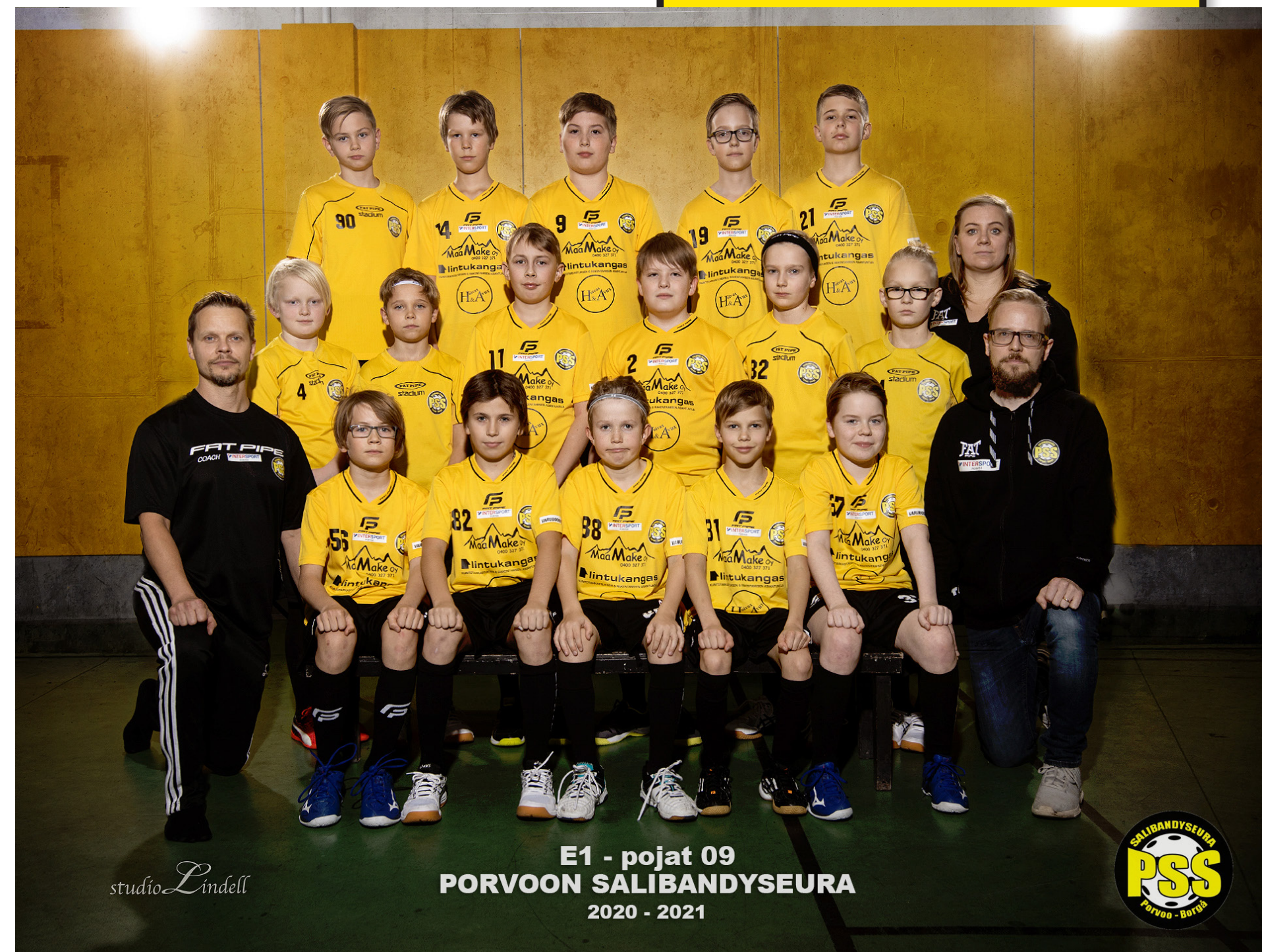
E1 - pojat 09 PORVOON SALIBANDYSEURA 2020 - 2021

PSS E1-pojat on vuonna 2019 syntyneiden pojankolttiaisten joukkue, toiset pojista tosin ovat joku vuotta nuorempia ja toiset vanhempia. Edellisen menestyksekkään, mutta lyhyeksi jääneen kauden jälkeen lähdettiin alempaan kilpasarjaan. Kyyti oli kuitenkin syksyllä kovaa ja kevään pelejä odotettiin jo innolla.