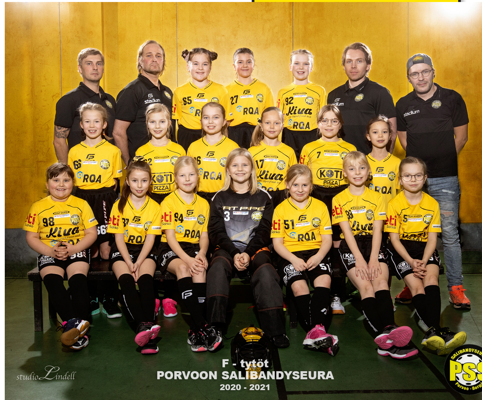
F - tytöt PORVOON SALIBANDYSEURA 2020 - 2021

F-tytöt ovat vuonna 11-13 syntyneitä tyttöjä, joiden tavoitteena on oppia ja kehittyä salibandy saloissa sekä pitää hauskaa. Harjoittelemme 2 kertaa viikossa, mikäli vallitseva tilanne sallii. Pelaamme myös sarjapelejä n.1-2krt/kk. Normaalioloissa teemme ti-