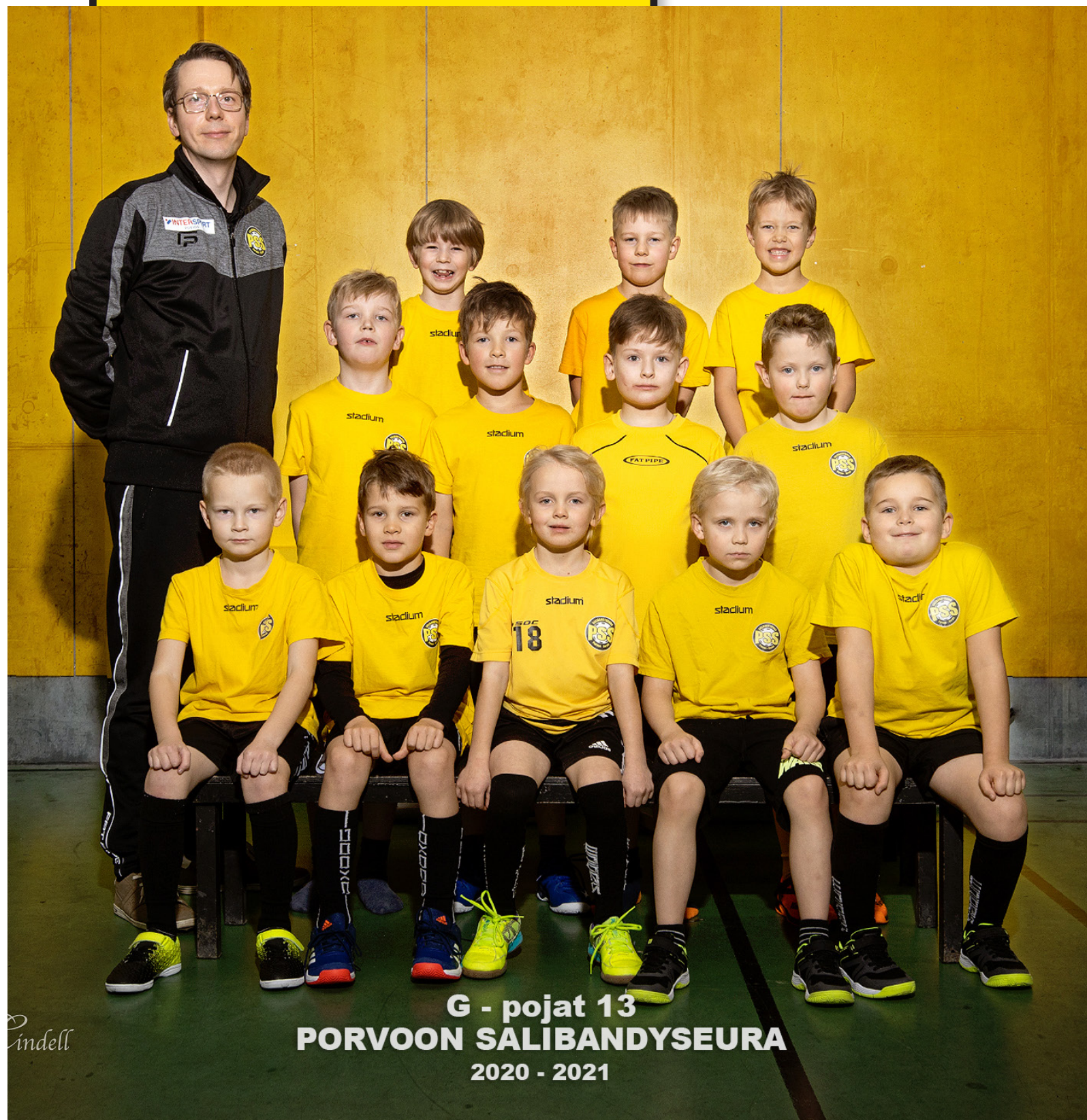
G - pojat 13 PORVOON SALIBANDYSEURA 2020 - 2021

G-pojat ovat joukko innokkaita ekaluokkalaisia pojanvii-kareita, joissa virtaa riittää eikä treeneissä askel paina! Syksyllä päästiin mukavasti treenaamisen makuun ja pojat ovat päässeet perehtymään salibandy perusteisiin useinkin eri valmentajan opastuksella. Osa on viihtynyt jo kauemminkin maila kädessä ja osallistunut mm. PSS:n nappulakerhotoimintaan, osalle laji on uusi tuttavuus. Kaikki pojat selvästi nauttivat lajista ja hauskin on tietenkin yhdessä pelaaminen. Hyvänä kakkosena taitaa tulla kinuski.