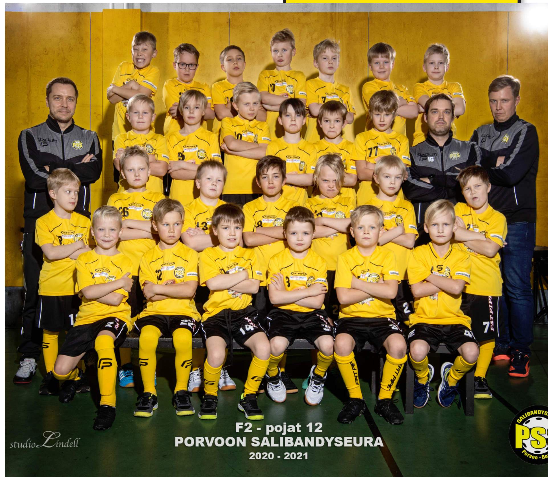
F2 - pojat 12 PORVOON SALIBANDYSEURA 2020 - 2021