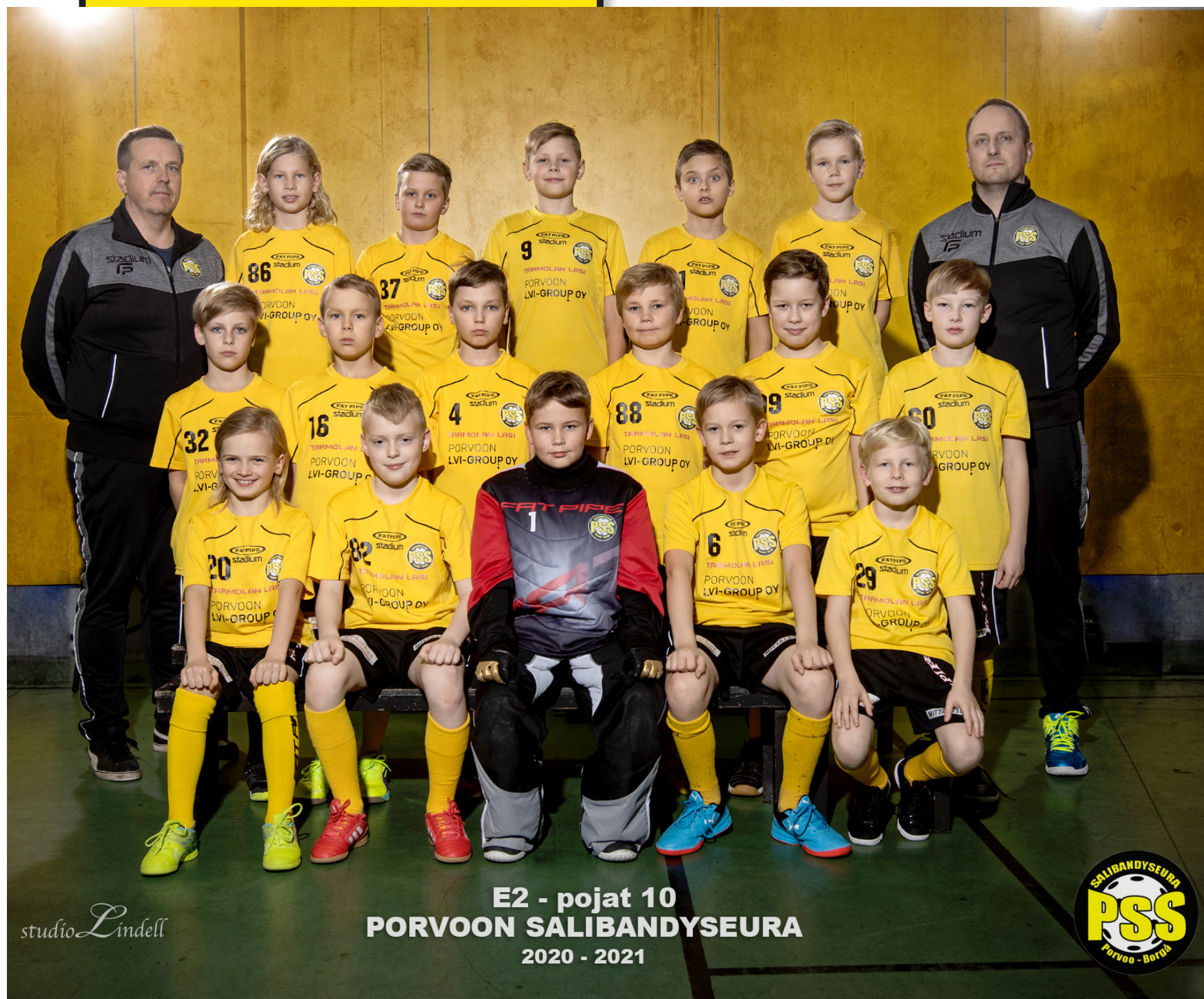
E2 - pojat 10 PORVOON SALIBANDYSEURA 2020 - 2021

E2-pojat ovat reilun 20 reippaan pojan joukkue, harjoitukset otamme tosissaan mutta pidämme kuitenkin pilkkeen silmäkulmassa. Tällä hetkellä pelaamme Etelä-Suomen aluesarjaa yhdellä joukkueella. Koronasta huolimatta ulkotreeneissä on riittänyt vilskettä ja tohinaa.