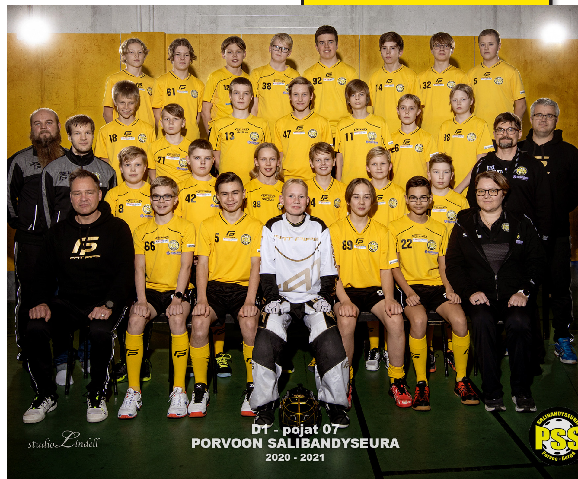
D1 - pojat 07 PORVOON SALIBANDYSEURA 2020 - 2021