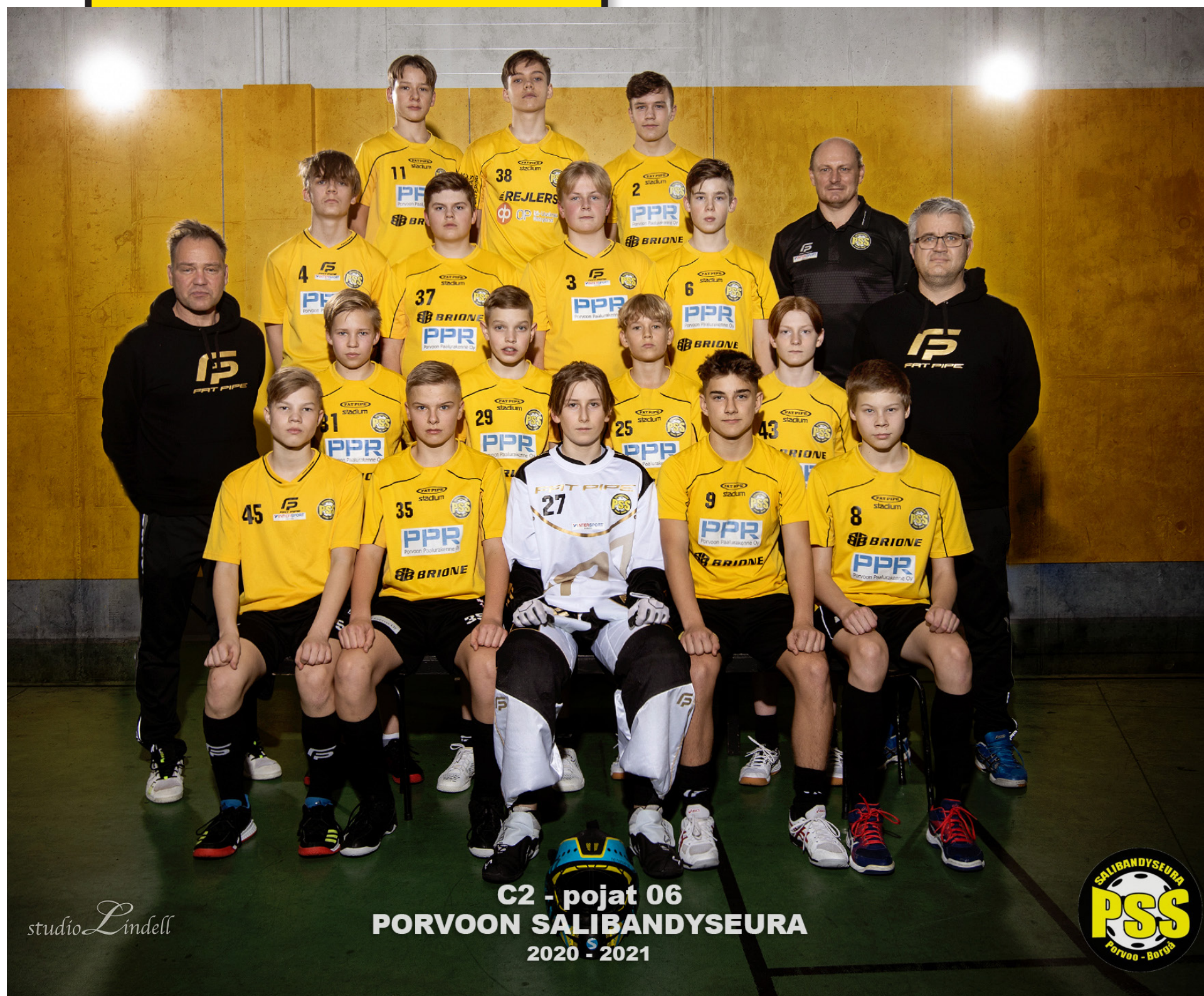
C2 - pojat 06 PORVOON SALIBANDYSEURA 2020 - 2021