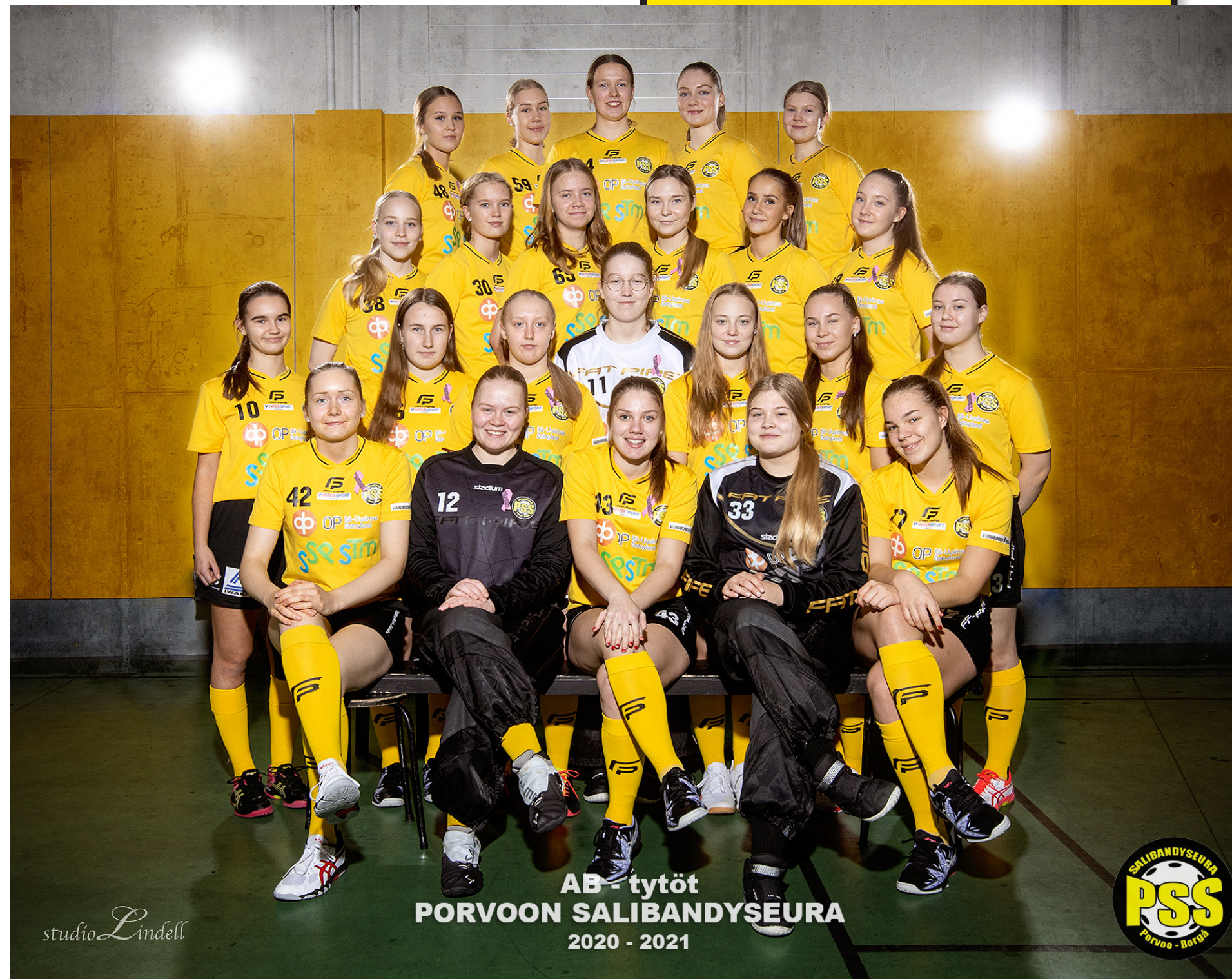
AB-tytöt PORVOON SALIBANDYSEURA 2020 - 2021